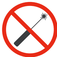
Pointeur laser Laserpointer