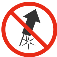
Objets pyrotechniques Pyrotechnic objects