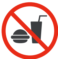
Nourriture et boissons Food and drinks