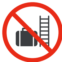
Objets volumineux Bulky objects

Liste non exhaustive. La Coque se réserve le droit de confisquer tout objet jugé non conforme.