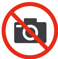
Appareil photo réflech Reflex camera