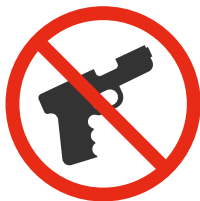
Armes, objets dangereux Weapons, dangerous objects

Visitors will be subject to security checks.