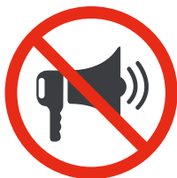
Dispositifs faisant du bruit Devices to make noise