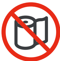
Rouleaux de papier / confetti Paper rolls / confetti