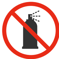
Aérosols Aerosol spray cans